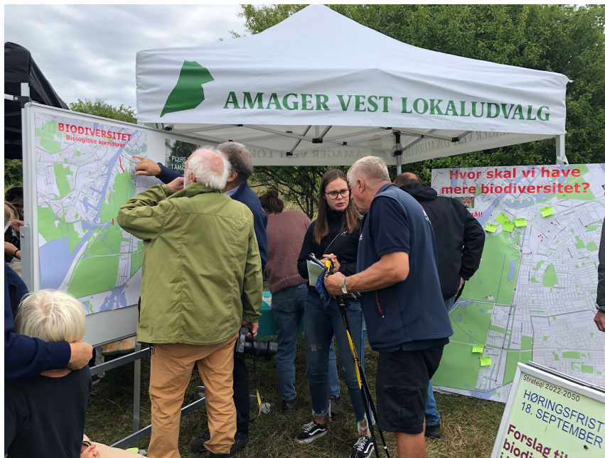
Fra Fælledens Dag 11.9.22

Her på den korte bane deltog lokaludvalget i orienteringsmødet d.1. september og borgermødet d.13. september 2022.