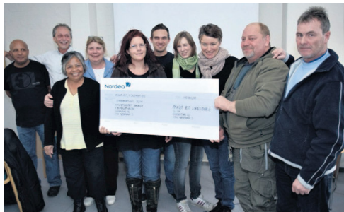
Lokaludvalg Amager Vest uddeler 100.000 kroner i form af Skulderklapprisen til Aktivitetscentret Sundholm.

De 100.000 kr. går til at føre det gode arbejde videre. Aktivitetscentret giver anstændige forhold til byens hjemløse