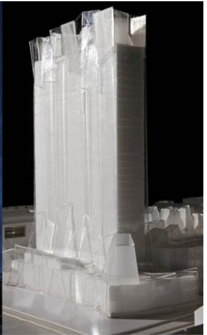
Kim Utzon arkitekter